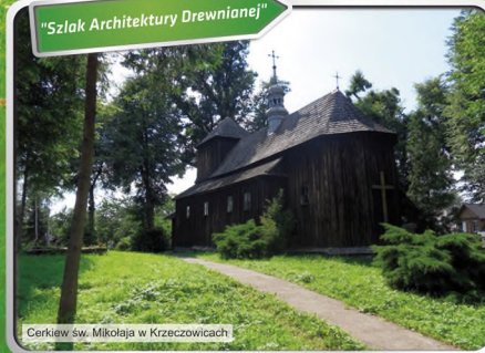
Cerkiew św. Mikolaja w Krzeczowicach