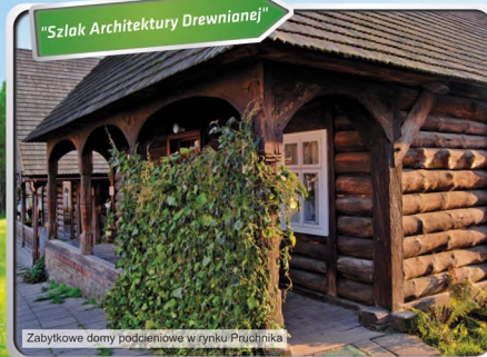
Zabytkowe domy poddaniowe w rynku Pruchnika