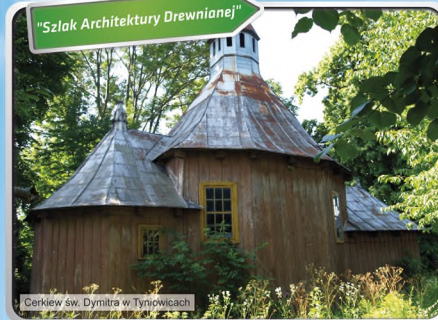
Cerkiew św. Dymitra w Tyniowiecach